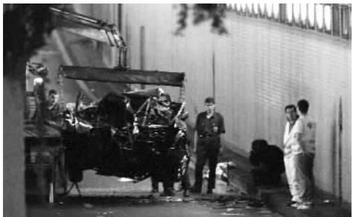
1997年8月31日,戴安娜王妃乘坐的轿车在法国巴黎一个公路隧道中发生车祸后,警察搬走轿车残骸

英国警方17日说,正在评估有关戴安娜王妃死因的新信息,包括戴安娜之死可能与英国特种空军突击队有关。警方同时表示,这不是重启调查。