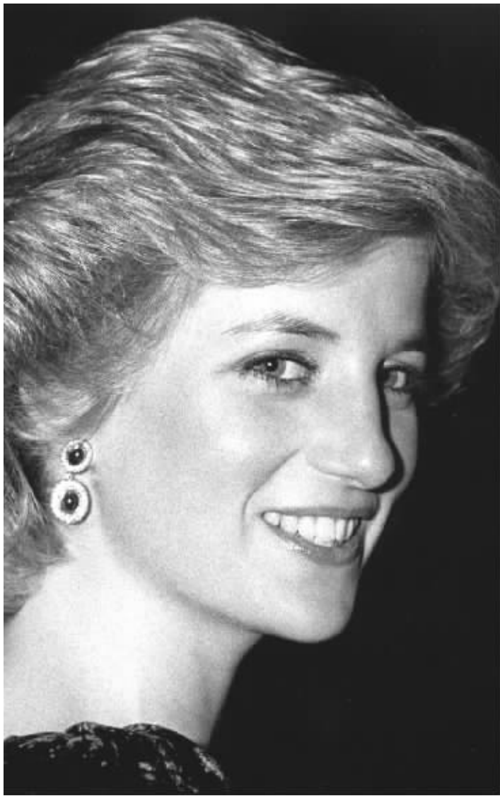
戴安娜王妃 资料照片