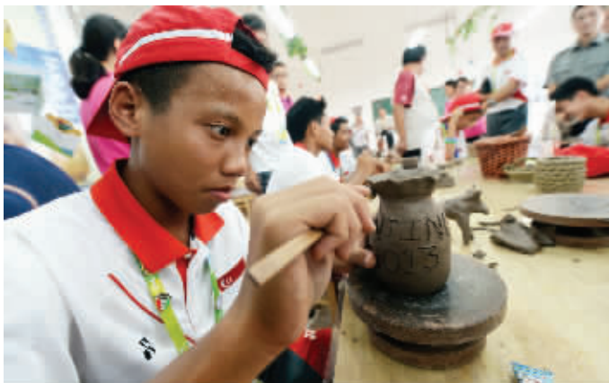
小运动员做出自己的奖杯

“快看这个化石标本”、“这里有茶艺表演”……新加坡的小运动员们一边参观,一边兴奋地呼朋引伴。