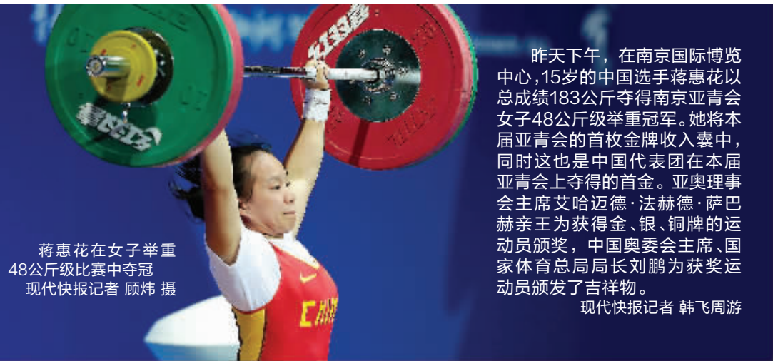
蒋惠花在女子举重48公斤级比赛中夺冠