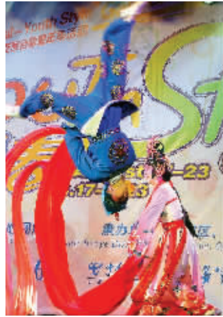
晚会上,国粹京剧压轴