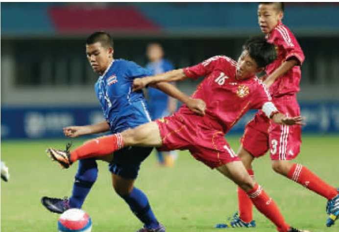
虽然最后输了,但比赛中,孩子们表现得很顽强