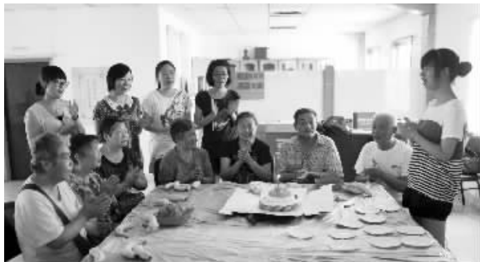
陪独居老人过生日 现代快报见习记者 邱雅真 摄