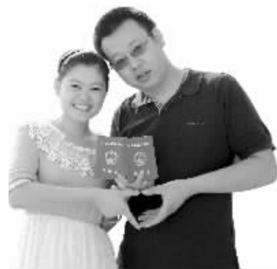
昨天,第一对在玄武区婚姻登记处登记的新人

昨天,南京共有747对新人领证,没有往年那么火爆 其中不少是“异地恋”,两地婚姻既有幸福也有无奈