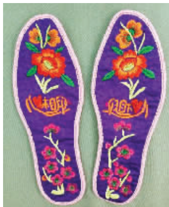
离别时,学生赠送的精美手工鞋垫