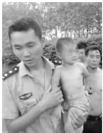
女童最终获救

扬州市宝应县汜水镇一名两岁的女童在家门口玩耍,20分钟后家人发现失踪。当地警方接报后迅速组织近百警民展开8个小时的搜救,最终发现小孩时,孩子半个身子已没入河水中,双手正出于本能地抓着岸边的水草,命悬一线,民警迅速将其救上岸。昨天上午,小孩的父母向警方送去了锦旗表示感谢。