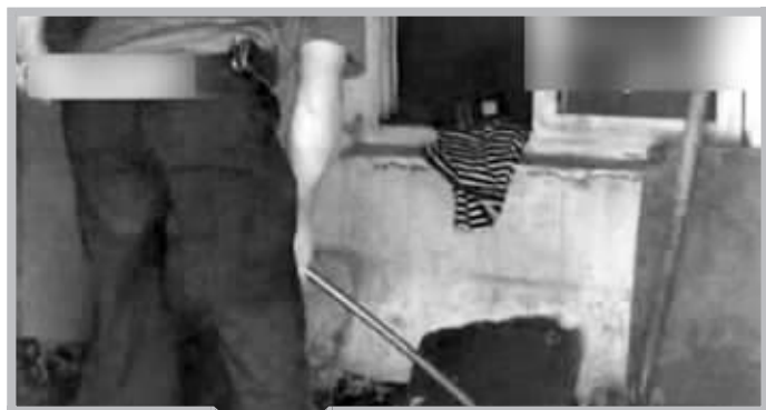
工作人员正在打捞 本组图片为视频截图