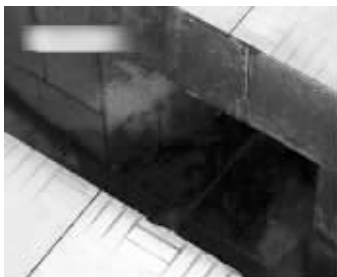
孩子从这里滑进化粪池

子的哭喊声,其丈夫听到后,冲了进去。有附近居民跑来围观,女子哭诉,自己快要生孩子了,上厕所时,哪想孩子突然从腹中滑出,掉进蹲坑里,然后被冲入两米深的化粪池。截至记者昨晚发稿时,孩子依然没有被打捞上来。