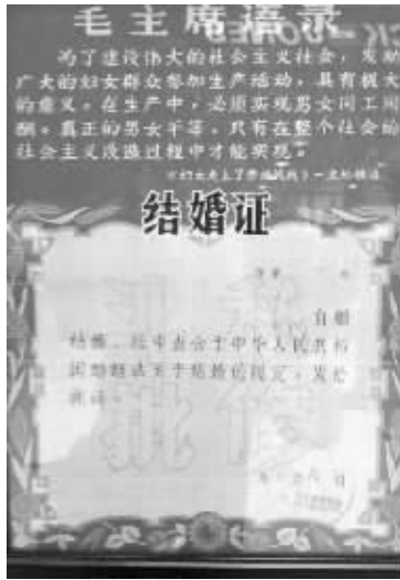
文革时期的结婚证

七夕节期间,泰州一家商场举办结婚证展,41张结婚证时间跨度长达百年。最早的来自清朝咸丰年间,从早期的童养婚帖到现在的结婚证,每张证书上都留下了时代的烙印,见证了社会的发展。