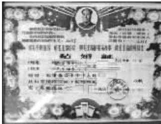
上世纪60年代的结婚证