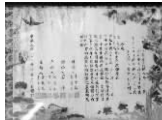
上世纪40年代的结婚证