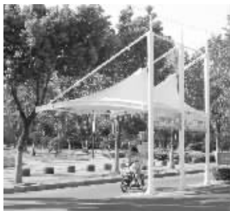
路口设置的遮阳棚

据悉,自进入夏季以来,六合区城管局多次组织城管队员和志愿者对随地吐痰、乱扔烟头、中国式过马路等违章行为进行劝导和制止。调查发现,夏季闯红灯的人比较多,其中一个原因是忍受不了骄