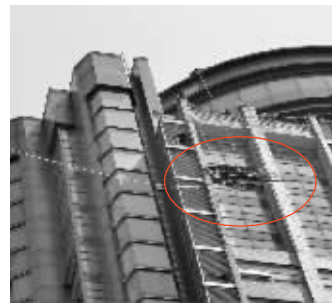
拆下来的巨型广告字

月10日,兴隆街道牵头组织区城管执法大队、兴隆派出所和治安巡警建邺大队进行联合执法。他们从凌晨4点半就开始拆除。