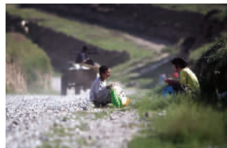
干裂松软的黄土掺杂着坚硬的碎石异常难行，小朋友们上学放学总是要歇上几歇