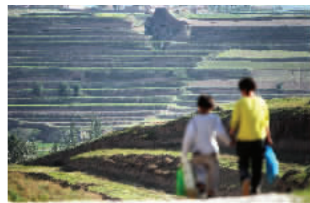
如此壮美的风景，却成为孩子上学路上的重重阻碍，一趟走下来3个小时过去了