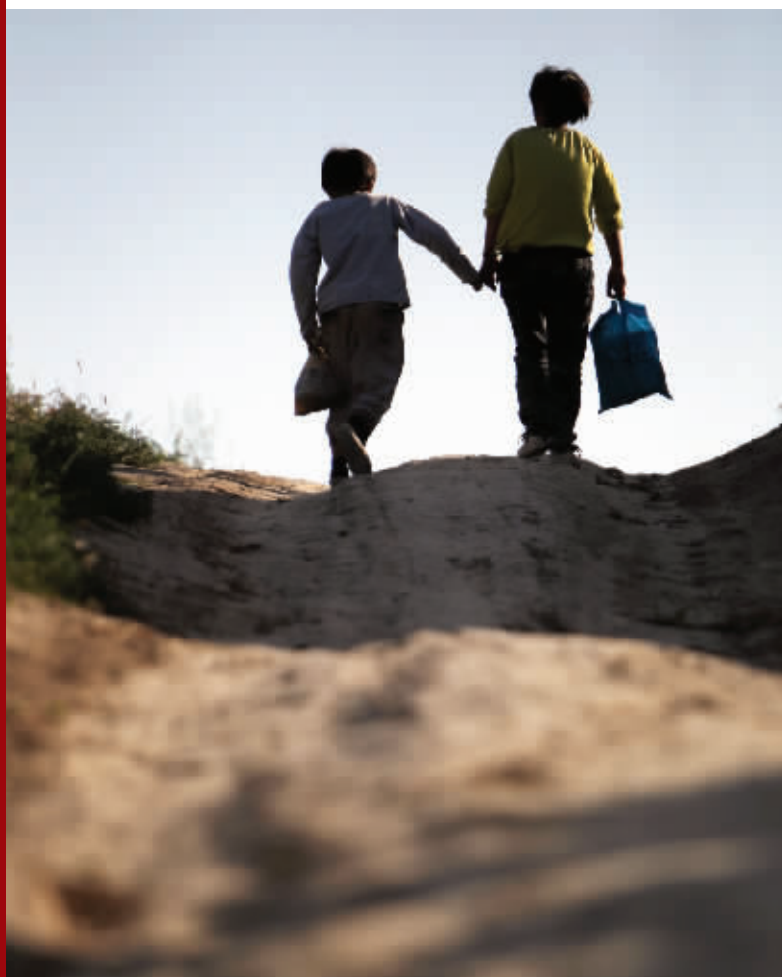
姐弟俩走在崎岖的山路上