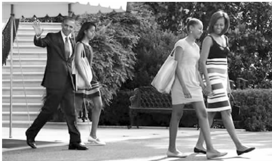
2013年6月26日, 奥巴马携妻女离开白宫前往非洲度假

不过, 奥巴马还不能就此完全进入“假期模式”。动身前往度假地前一天下午, 奥巴马将召开新闻发布会, 预计会谈及美国海外使馆恐怖威胁以及美俄关系。