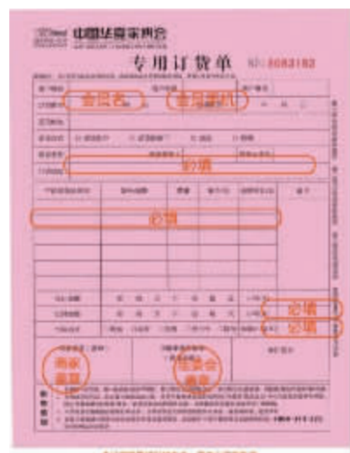
华夏家博会专用订货单

华夏家博会主办方全面升级CRM客户服务系统,在展期全程提供免费饮用水,提供清凉舒适的洽谈区域,布置尊崇主席,为消费者送一丝凉爽的同时,也将我们的感恩一同送出,立即官网索票到场,凭礼品卡来就送精美礼品,100%有礼。