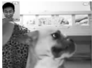
哼, 我一点都不想你