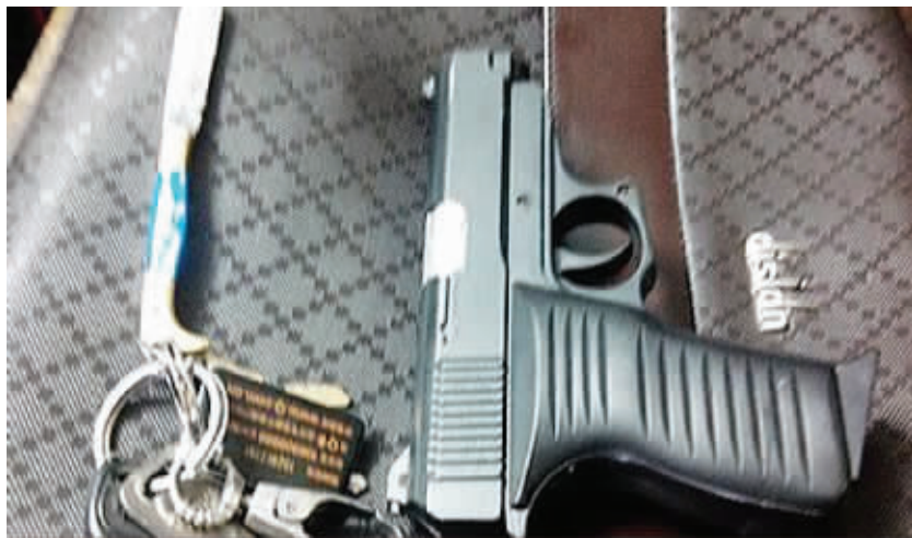
李先生自称安检未能查出的仿真钢枪