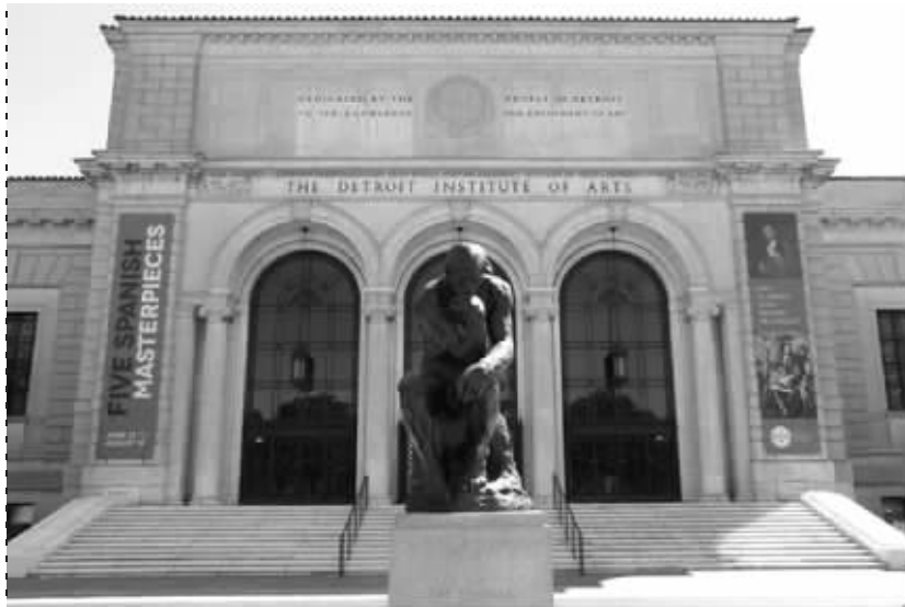
底特律艺术馆门前的雕塑为奥古斯特·罗丹的雕塑作品《思考者》