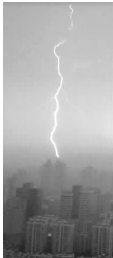
昨天下午,南京上空的闪电图片来自“@南京发布”微博