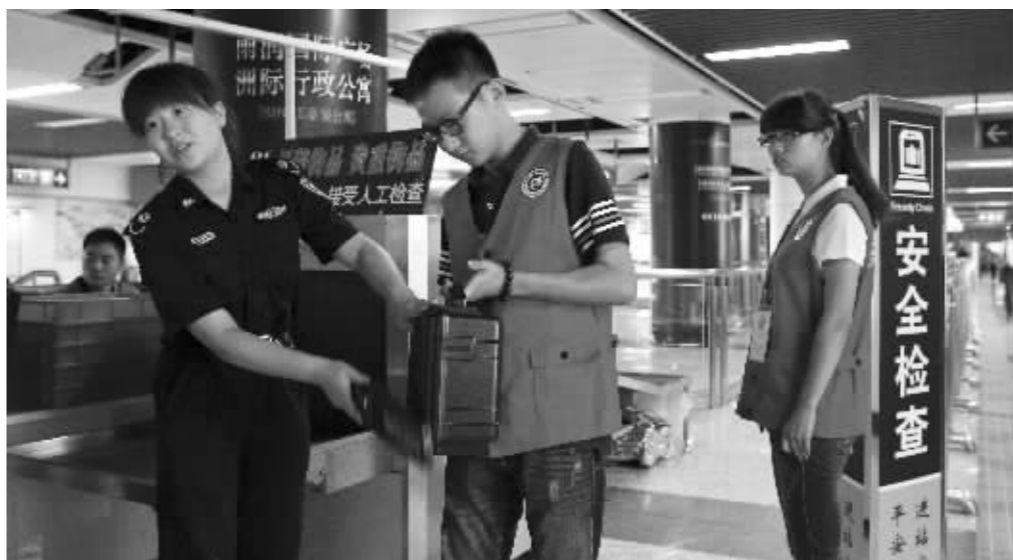
昨天,南京地铁开始试行安检