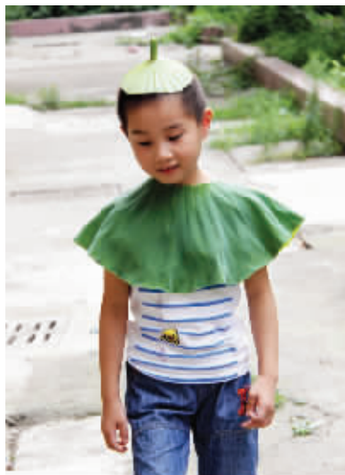
2 你可以假装看不见，我摘了荷叶做披肩，可惜遮不住我有点羞涩的脸。 7月27日摄 (作者老徐)