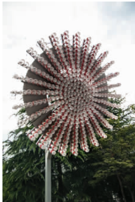
风车灯 用一堆矿泉水瓶，做成一个“大风车”灯。是不是风足够大的话，就能够自发电点亮？7月20日摄于河西大街