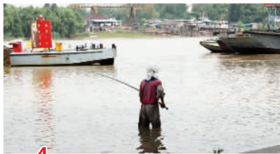
4 你可以假装看不见，我真的跳到水里面，就想把鱼竿当捞网把鱼来捡。7月26日摄