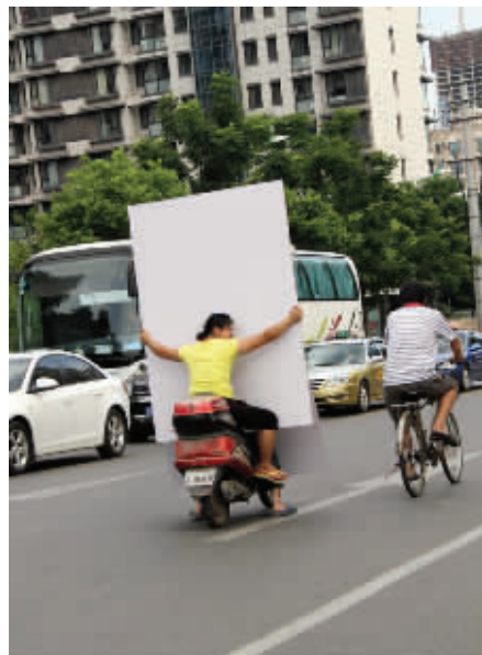
“帆车” 好风凭借力，送你回到家！大姐，悠着点，逆风你就撒手吧。 7月27日摄 (作者徐慧知)