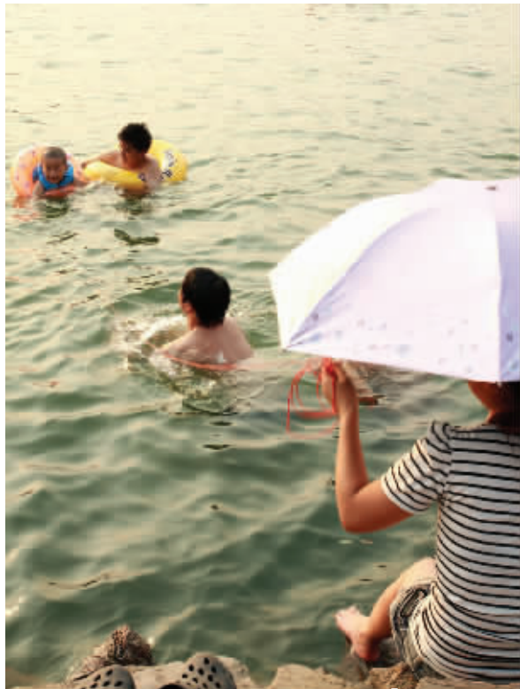
1 “冒烟”的夏天，我要泡在水里，身上有根红绳子，我妈在那头牵。 7月29日摄于花神湖