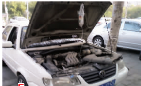
5 汽车也蔫了，好像中暑了，躲在树阴下开始吊水了。7月25日摄于月苑经五路和营苑路路口