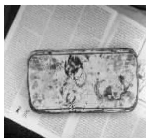
用了20多年的文具盒