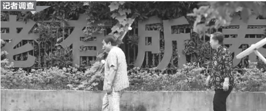
江苏某地老年公寓前老人在散步