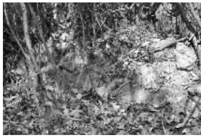
牛首山抗金故垒 资料图片