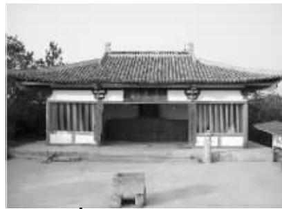
将军山岳王祠 资料图片