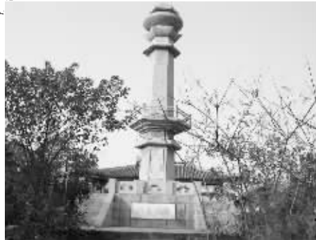
将军山将军塔 资料图片

建炎四年(1130年)4月,岳飞率兵自宜兴西进抵江宁,在清水亭大败金兵。有资料记载,清水亭一仗,金军遭到岳飞阻截,横尸15里。