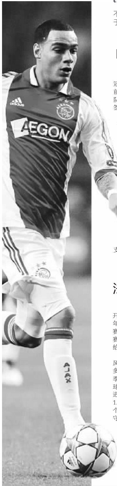
阿贾克斯是荷甲传统豪门

值得一提的是,荷乙、法乙的赛季都刚刚开始,因此球队存在磨合以及寻找比赛状态等问题。所以首轮比赛,建议彩民最好复式防冷。