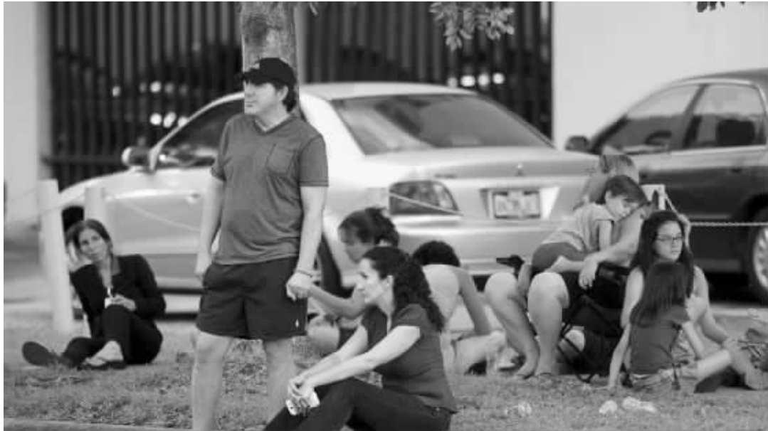
事发公寓楼被封锁,惊恐不已的人们聚集在一起