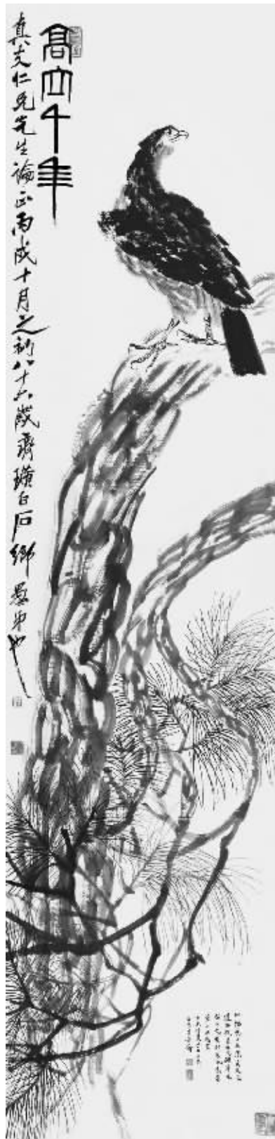
齐白石《高立千年图》