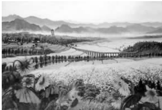
吴作人《战地黄花分外香》