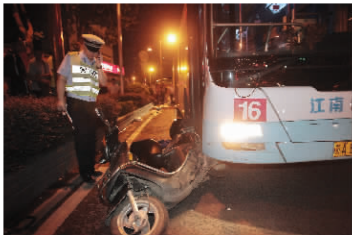
警方在车祸现场勘察