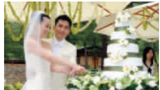
两人当年的结婚照