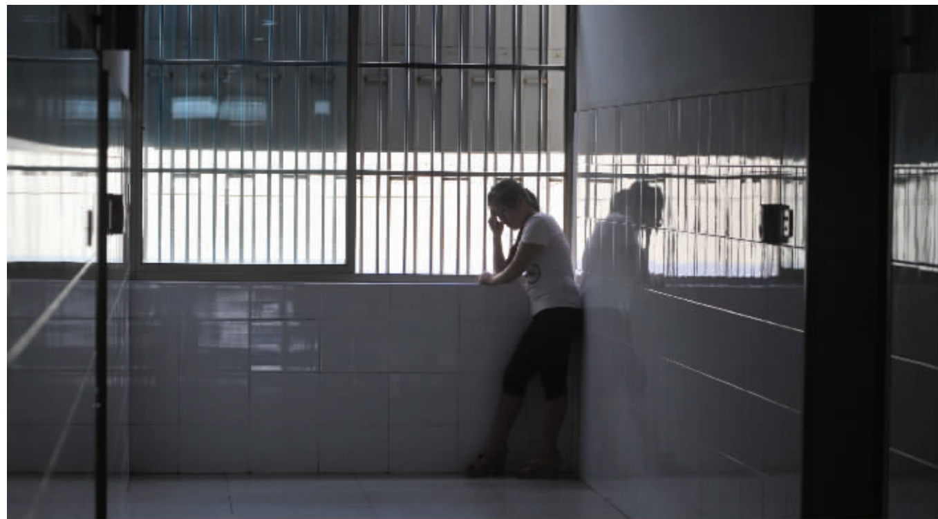
因为无法跟救助站工作人员交流,更多时候,女孩都是一个人孤独地呆着

南京市救助管理站(以下简称“救助站”)地处栖霞区。一个多月前,这里来了一位奇怪的姑娘,她从来都不跟人聊天,一天到晚都不怎么说话,每次有人离开救助站,她都会哭。