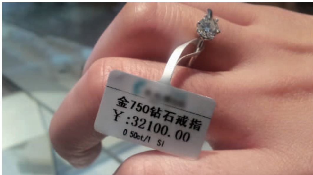
在本地一家商场珠宝专柜,一枚18K金,颜色为I色的50分钻戒,竟然卖到3万2千多元,而一线城市只需要1万元出头就能买到,差价2万多元。

专家同时支招,市民只要简单掌握一些关于钻石的基本常识,买钻戒就能为自己省下不少钱。