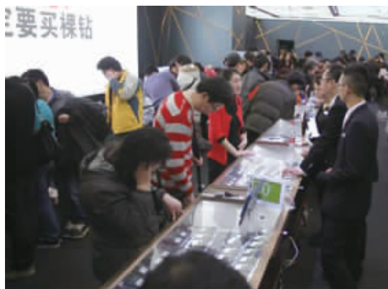
▲“钻石是女人的最好朋友”,在一线城市,钻石价格相对透明,市民买钻戒像买菜一样简单。

也有业内人士指出,在北上广,很多市民在购买钻戒前,都会做足功课,了解相关钻石知识,钻石的4C是什么?什么样的钻石能保值?有些市民的珠宝知识,甚至比销售人员都多。这也让很多商家不敢随便卖高价。而在南京街头随机调查了20位市民,只有4位市民知道,购买钻石要首先看钻石的4C,很多市民,还是会轻信商家所谓的“南非钻石”“意大利工艺”等宣传噱头。