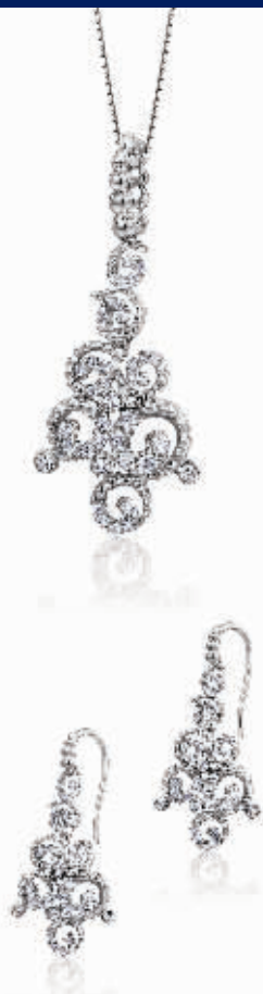
通灵珠宝“红毯MINI”系列“茜茜公主”钻石饰品