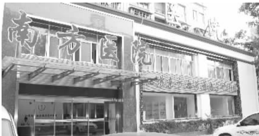
▲江苏南方血管病医学研究院大楼