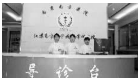
◀江苏南方血管病医学研究院导医台