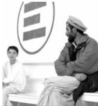
病人在“急救”组织所建的医院等待治疗