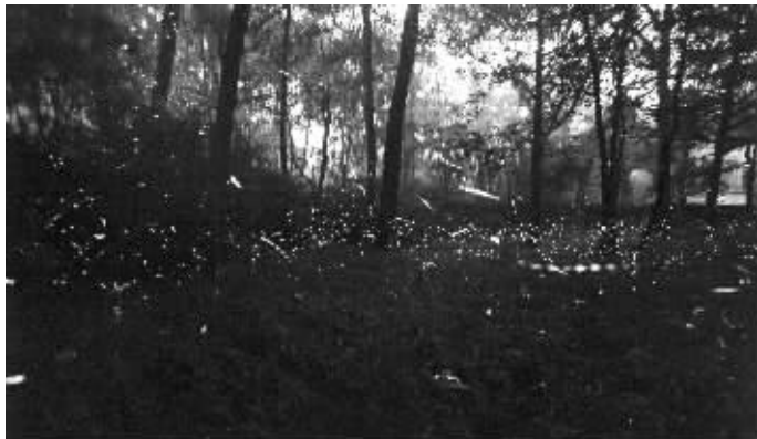
请大家科学观赏紫金山上的萤火虫