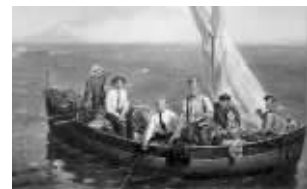
油画《列宁和高尔基钓鱼》

昨日,俄罗斯珍藏油画巡回展在无锡中国艺术研究院中国画院研创基地内举行,此次共展出了77幅俄罗斯油画,有的油画至今已有100多年历史,其中,《列宁和高尔基钓鱼》被圈内人士估价不低于100万元人民币。该作品创作于1932年,作者切普措夫·叶菲姆·米哈伊洛维奇是伊万·列宾的学生。这位艺术家,在意大利时认识了高尔基,从此结为好友,因此为画作增添了故事色彩。