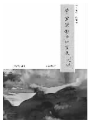
《中国泼彩山水画史》封面

7月21日上午九点，作为南京市新华书店暑期书香计划重要活动内容之一，《中国泼彩山水画史》首发研讨暨邵晓峰教授书画展将在南京新街口新华书店13楼会议室、艺廊举行。当天南京新街口新华书店一楼大厅、四楼艺术书区限量销售此书的著者签名版。