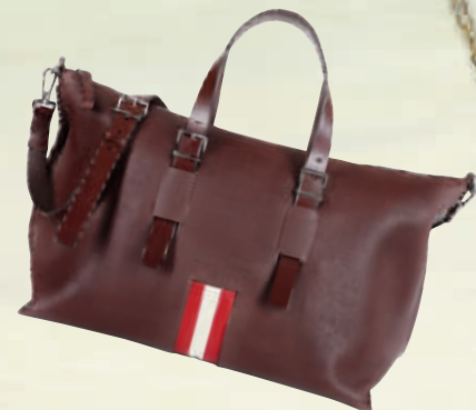
Bally Stripe Capsule 系列 Weekender休闲手提旅行袋