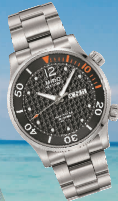
美度舵手系列 双表冠潜水腕表