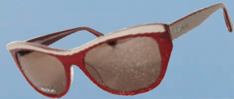
Max Mara 2013春夏款太阳镜