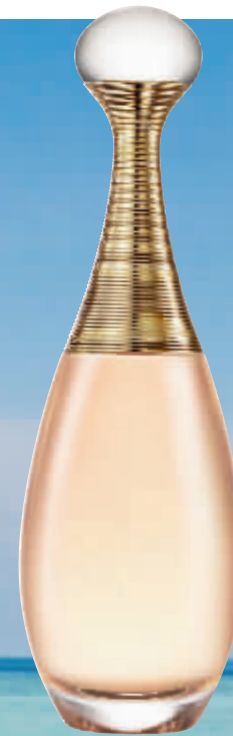
Dior迪奥真我情柔淡香水