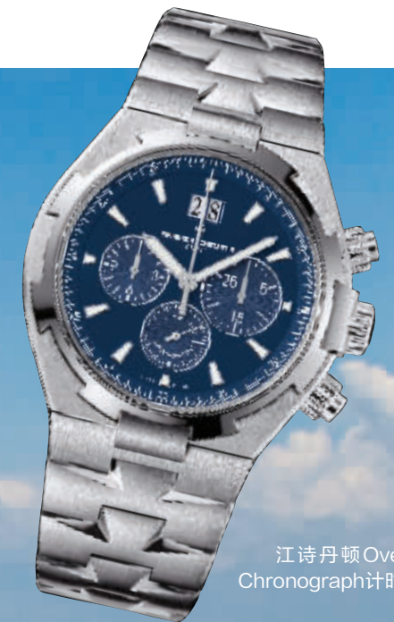
江诗丹顿Overseas Chronograph计时腕表