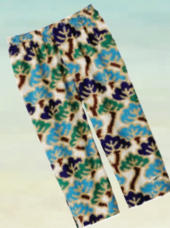
优衣库男装SOU·SOU平角裤