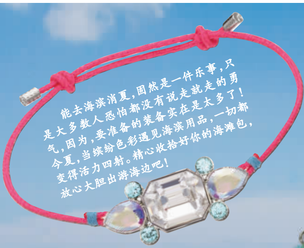
施华洛世奇Tosha Pink 手链