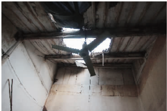
高岗里39号老宅受损的房顶