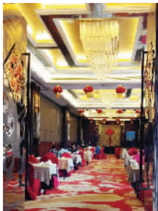
湘鄂情用餐大厅只有两桌客人