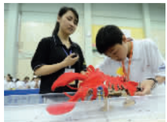
龙虾机器人

这两天,微博网友“詹姆斯韦”发布了一组《紫金山,神庙,流萤》的照片,他拍下的数百只萤火虫飞舞的景象,令无数网友惊叹。就在今年的5月22日,南京环保组织“微光公益环保团队”在紫金山对萤火虫生存状况进行了今年首次考察,结果令人失望,3个小时只看到两只萤火虫。昨天,快报萤火虫科考队(微光公益环保团队)再次走进紫金山,对萤火虫的生存状态进行考察。 现代快报记者 胡玉梅 安莹