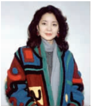
邓丽君罕见生活照

邓丽君大型互动演唱会 售票热线(市内免费送票) 66032239 66032312 网购 永乐票务www.228.com.cn