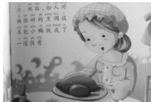
《一只丑小鸭的悲剧》(节选)