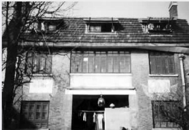
曾经位于南捕厅的王公馆(翻拍)