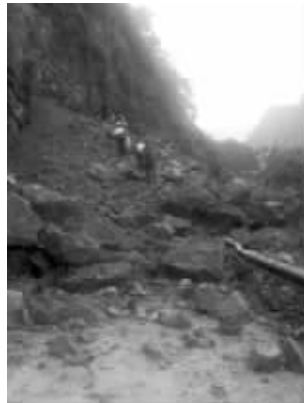
塌方路段

7月14日早上6点39分,贺子航继续“现场直播”,她发布了一张现场塌方的图片,“疏通估计要到晚上,已经有人在徒步翻越。”而很快,贺子航也决定徒步走出塌方路段。