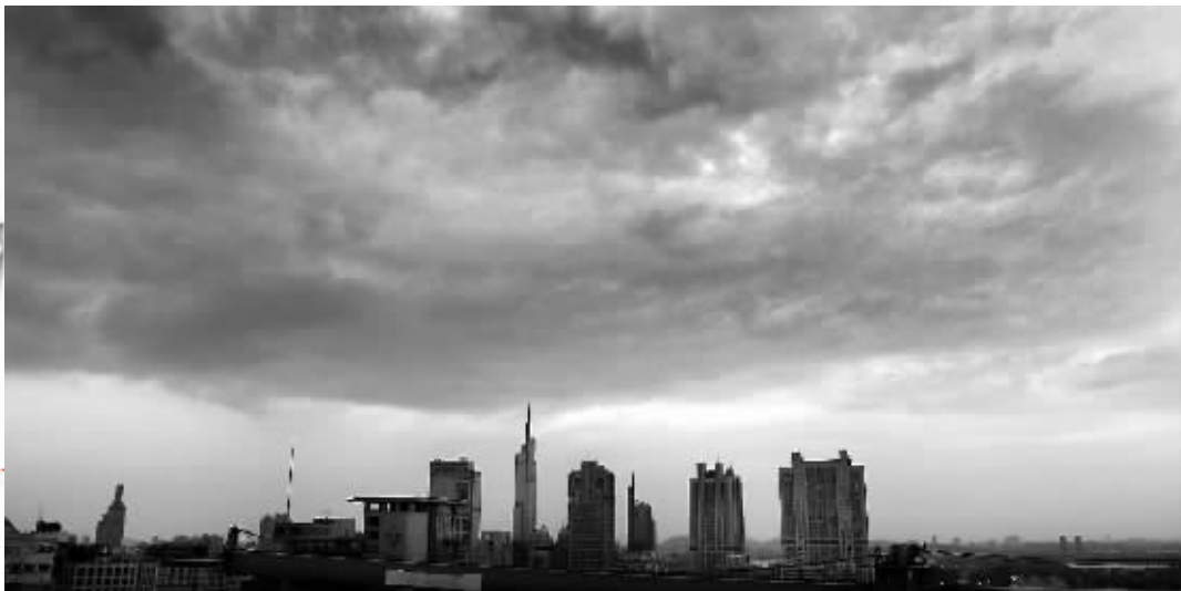
昨天下午,南京城受台风“苏力”的外围云系影响,乌云压境,气温也有所下降

原本说好双休日会下雨,这对于被高温“煎烤”了很久的南京市民来说,是个期盼已久的好消息。但是,苏力走了,雨却没下,只是为南京带来了一点风。眼下,台风影响基本结束,而苏南地区的高温天气正虎视眈眈,欲卷土重来。