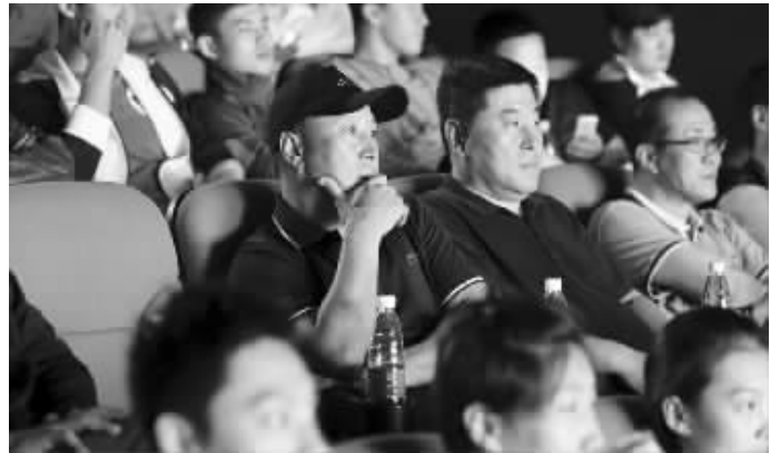
李永波带着国羽队员观看电影

前天上午,由韩国著名恐怖片导演安兵基执导的《笔仙II》在青岛举行了媒体看片会,当晚,中国羽毛球队总教练李永波率林丹等国羽队员到现场观影。李永波在片中本色出演了一个羽毛球教练,在接受采访时,他表示,如果不耽误训练并不反对队员去演电影,而林丹希望将自己的自传改编成电影,一部以羽毛球为题材的体育励志片也正在酝酿中。