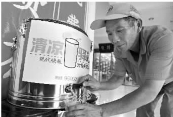
一名环卫工在大世界茶城“清凉驿站”喝茶

继前天百家门店加入现代快报发起的“共建清凉驿站”活动后,昨天又有超过300家门店愿意为坚守高温岗位的劳动者们提供歇脚喝茶的地方。此外,南京市体彩中心还为环卫工送去300台电风扇,热心市民徐先生也送来100盒人丹和清凉油。今天起,各共建单位将在门店显眼处,张贴“清凉驿站”标志。室外工作者可前往贴有标志的苏宁电器、五星电器、南京市体彩中心、金陵大药房、大世界茶城、钱塘人家酒店等门店休息纳凉。