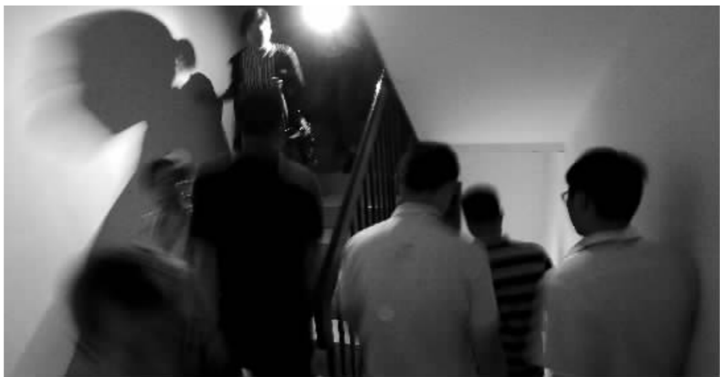
置地广场限电,白领们用手机照明走楼梯

昨天,南京的众多单位和商家经历了一次较长时间的限电。没电的生活,让人突然蒙了:从写字楼的车库、电梯、食堂到开水房,集体“罢工”,一整天下来,不少白领手忙脚乱,经历了闷热、爬楼、没饭吃等各种“摧残”。