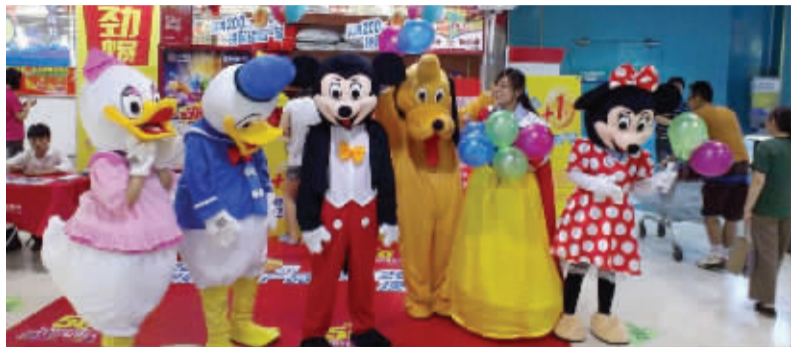
家乐福南京大行宫店卡通玩偶大巡游现场蛋糕义卖,这是此次庆典的重头戏。

6月底开始,家乐福50周年店庆活动全面启动。可爱的玩偶、美丽的舞娘还有幽默的小丑,观众熟知的明星们都被家乐福请到了各个门店,为顾客带来精彩表演的同时,现场还有礼品派发。记者了解到,从本周二开始,家乐福50周年庆典第二波促销将强势登陆家乐福南京各门店,除了精彩的现场活动,喜爱绘画的小朋友将齐聚大华店共绘百米画卷。