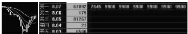
中石油近期走势K线与昨日尾盘大单

昨日沪深股市大跌,中石油再现巨单拉抬护盘,14:56,一笔超2万手单子直接拉红,截至收盘,中石油涨0.12%,报8.07元,股价连续8连阳。7月首周,A股市场多次出现中石油等权重股尾盘拉升现象,“护盘”意图明显。但多位券商人士认为,“护盘”行为短期或有一定效果,但长期难以左右市场整体走势。综合《每日经济新闻》