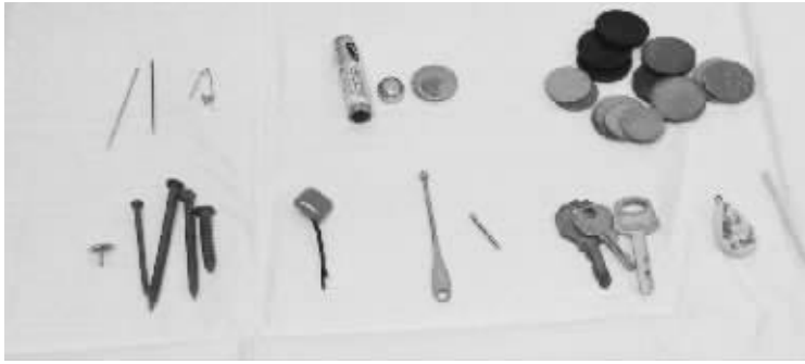
儿童医院展示的异物