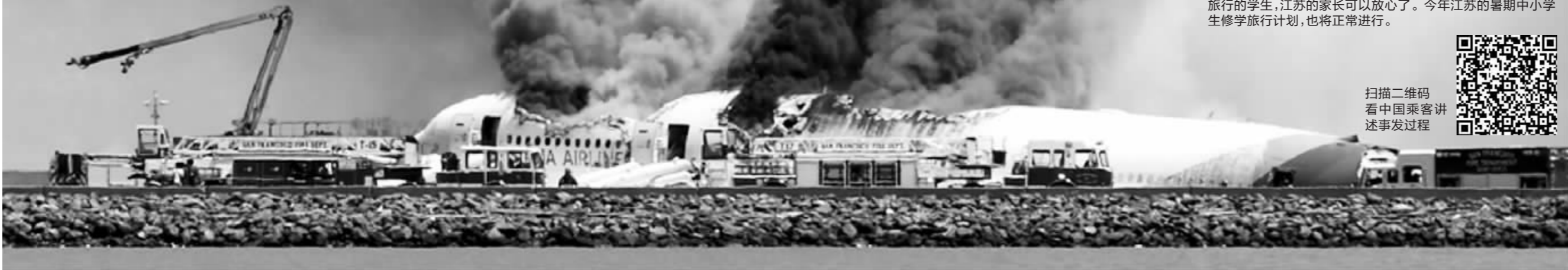
飞机失事后浓烟滚滚

北京7月7日凌晨3时左右,也就是当地时间7月6日11点半,一架韩亚航空公司的波音777型客机在美国旧金山国际机场着陆时失事,机尾折断,引发大火。机上共有291名乘客及16名机组人员。截至目前,此次事故造成2人死亡,全部为中国公民,有182名伤者,其中49人伤势严重,美国初步排除恐怖袭击。