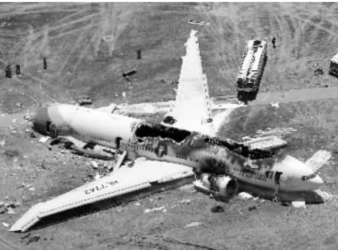
在美国旧金山国际机场失事的波音777客机

机上乘客描述说,相比平时时,这架航班降落时高度不够,且速度过快,当飞机快要接近地面时,飞行员