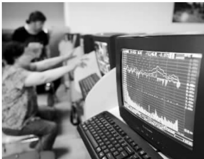
沪指依然在2000点附近徘徊

有分析人士认为,临近半年报披露期,上市公司真实业绩将成为市场关注焦点。在上半年宏观经济整体趋弱的背景下,业绩分化导致的股价分化也是在所难免。在这样的业绩证伪期,虽然可能出现少数强者恒强的局面,但同时存在的结构性机会将显著降低。