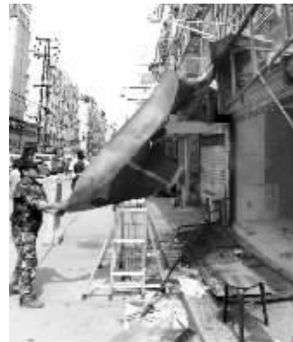
街道城管在拆违

“政府曾帮助统一制作门头,怎么突然就变成违建了?”昨天,当城管执法队员要进行统一拆除时,