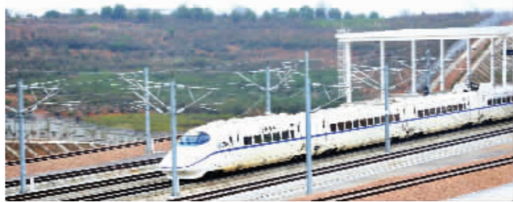
天变变途途,相信很快荒地也会变楼房

作为南京南大门的溧水,在2006年规划部门就已经将溧水定义为“新城”。今年二月,溧水撤县建区,这一消息直接将溧水房价推高了一个档次,“均价5000,落户南京”的口号被炒得沸沸扬扬。日前,记者调查了包括君悦华庭等在内的几个楼盘,虽不及2月“撤县建区”所带来的影响那么大,但基础价格都有了小幅波动。