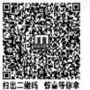
扫二维码 惊喜等着你