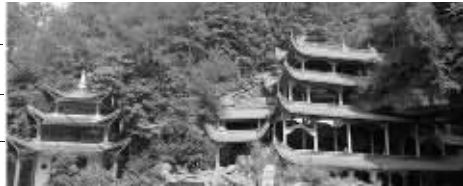
浙江天台山慈恩寺